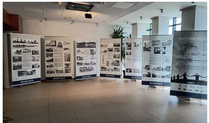
Izstāde “Baltijas ceļš dokumentos, atmiņās, sirdīs” Smiltenes kultūras centrā.

Izstādē apskatāmas dokumentārās liecības no Latvijas Nacionālā arhīva, Lietuvas Centrālā valsts arhīva, Lietuvas Valsts mūsdienu dokumentu arhīva un Igaunijas Nacionālo arhīva, tajā apskatāmas arī fotogrāfijas no akciju dokumentējušo fotogrāfu privātajiem arhīviem.