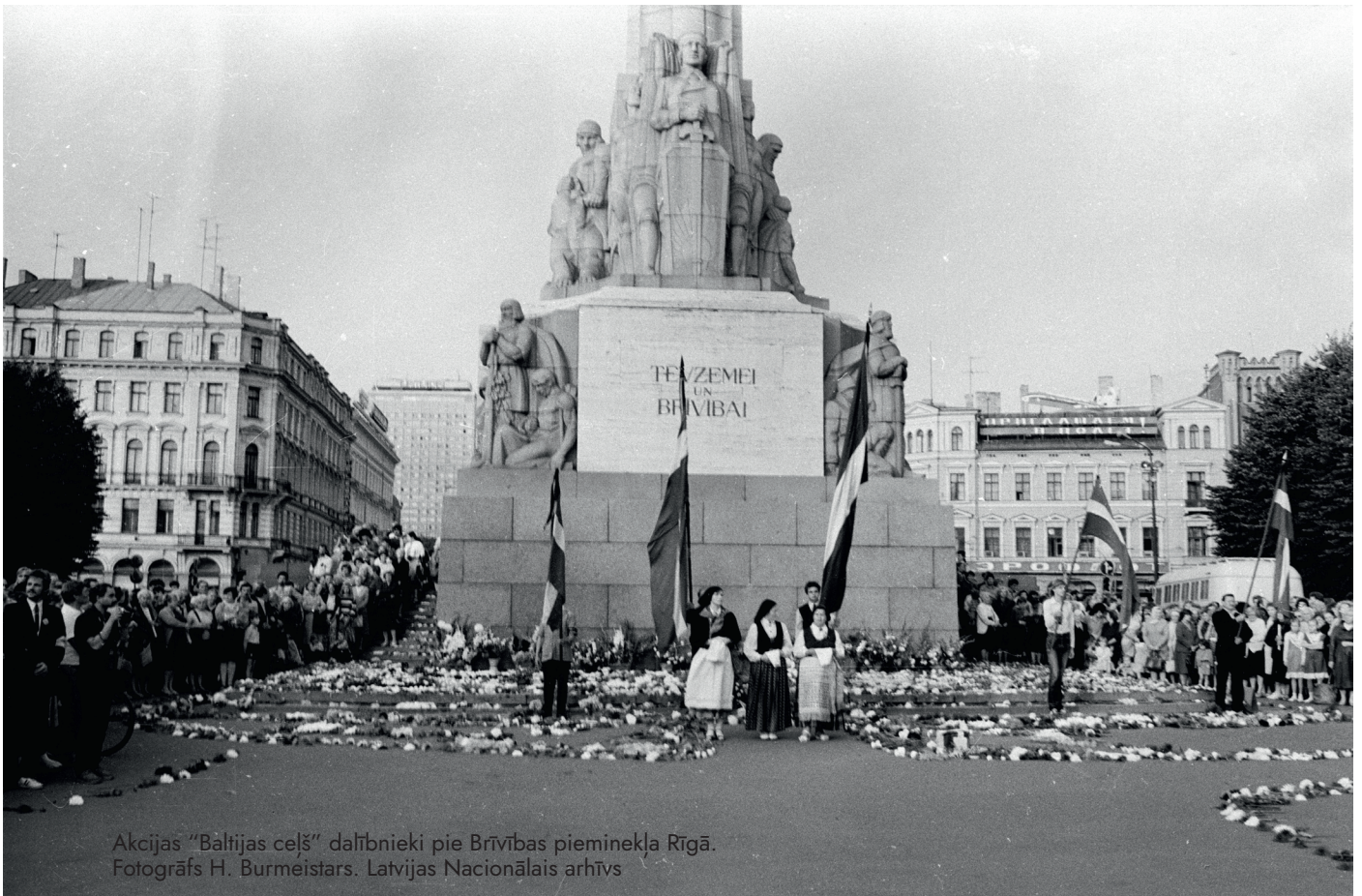
Akcijas “Baltijas ceļš” dalībnieki pie Brīvības pieminekļa Rīgā.

Brīvības laukumā Rīgā līdz 10. septembrim apskatāma Latvijas Nacionālā arhīva veidota dokumentāro liecību izstāde “Akcija “Baltijas ceļš” – vienoti brīvībai”