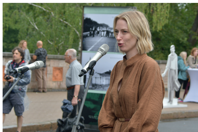
Izstādes "Akcija "Baltijas ceļš" – vienoti brīvībai" atklāšanas pasākums. Rīga, 2024. gada 23. augusts.