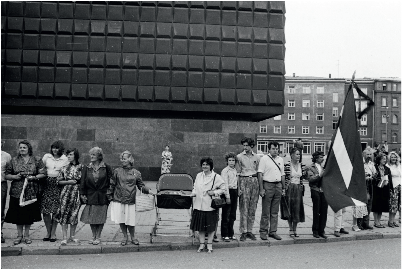
Akcijas “Baltijas ceļš” dalībnieki Rīgā.

Izstāde ir veltījums Baltijas valstu vēsturē nozīmīgākajai un starptautiski plaši zināmajai Latvijas, Lietuvas un Igaunijas kopīgajai nevardarbīgajai akcijai “Baltijas ceļš” ceļā uz valstiskās neatkarības atjaunošanu.